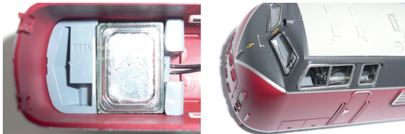
Bild oben: Der obere Teil des Führerstandes einer V 200 der Spurweite N dient als Resonanzraum. Die Lautsprechermembrane des Miniaturlautsprechers 31101 strahlt dabei nach unten zum Drehgestell ab.

Bild oben: Hier wird der Tender einer BR 10 der Spurweite H0 mit vorinstallierter Halterung für die Miniaturlautsprecher 31102 genutzt.